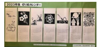
5組の「2023年切り絵カレンダー」