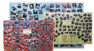
2年各学年の「川越学習写真館」