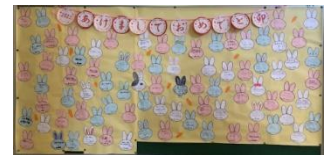
3年生全学年の生徒の新年の抱負

子どもたちはこのように前向きに生活しています。「コロナ後」も見え始めました。しかし、この3年間が子どもたちに与えた影響は計り知れません。一方、子どもたちが得たものもあるはずです。これらのことを常に意識しながら、次の局面に向かっていきます。今月も、どうぞよろしくお願いたします。