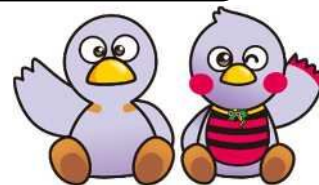
埼玉県マスコット 「コバトン&さいたまっち」

埼玉県公立高等学校入学者選抜の出願、学力検査、入学許可候補者発表の情報に加え、志願者倍率、学力検査得点の閲覧などの情報をお知らせします。